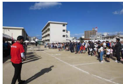
2019年10月 体育祭 公民館主催