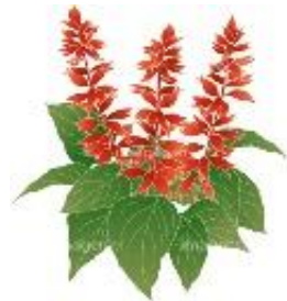
雄郡の花 サルビア