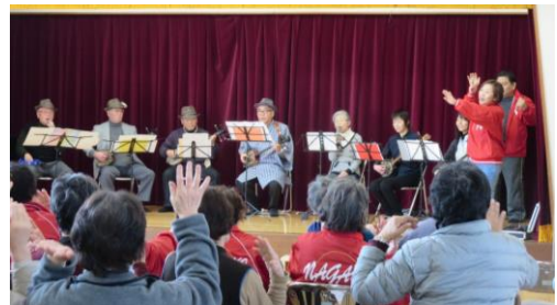
2018年3月 第1回雄郡スマイルカフェ