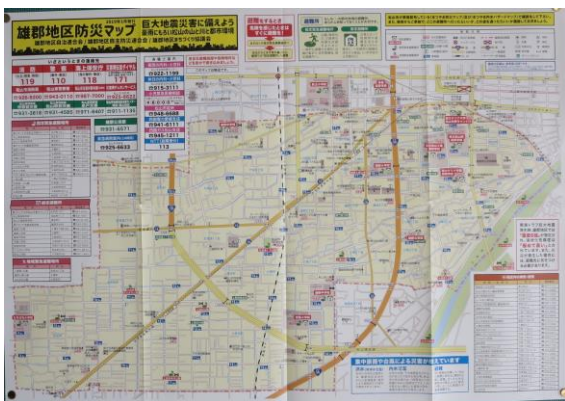
2019年1月「雄郡地区防災マップ」発行