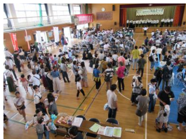
2019年6月 第6回福祉まつり