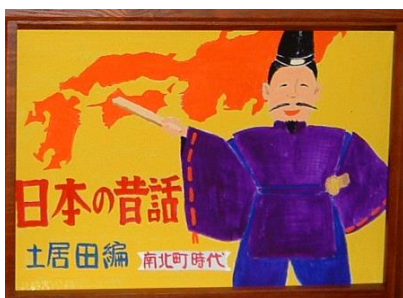
紙芝居第1作 「土居田の昔話」