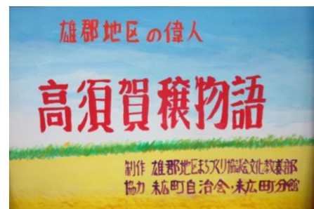
第3作 「高須賀 穰物語」