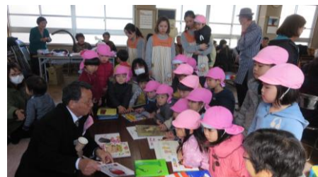
2019年3月 雄郡スマイルカフェin針田