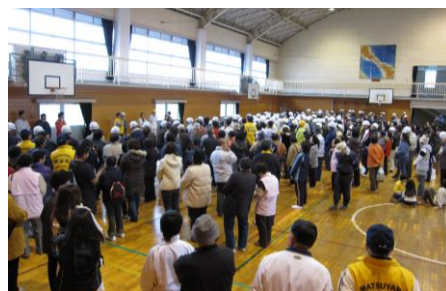
2008年11月 第1回雄郡地区防災訓練