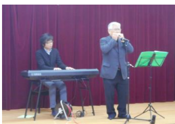
2019年2月 第6回音楽&芝居