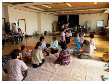
2019年10月 子育てサロン 雄郡公民館