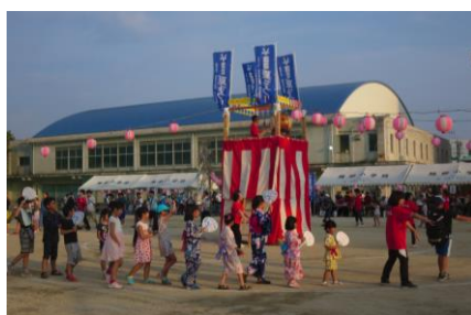
2019年8月 サルビア夏まつり 公民館主催