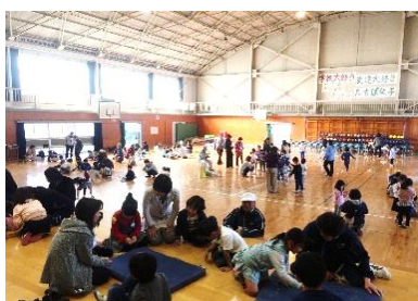
2018年11月 三世代交流会 たちばな小学校