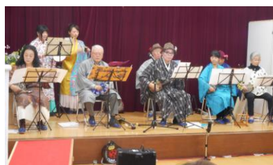
2019年2月 第6回音楽&芝居