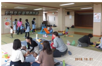
2019年10月 子育てサロン 土居田分館