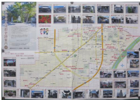
2018年4月 「ふるさと雄郡史跡案内」発行