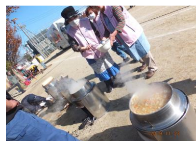
2019年11月 防災訓練 炊出し