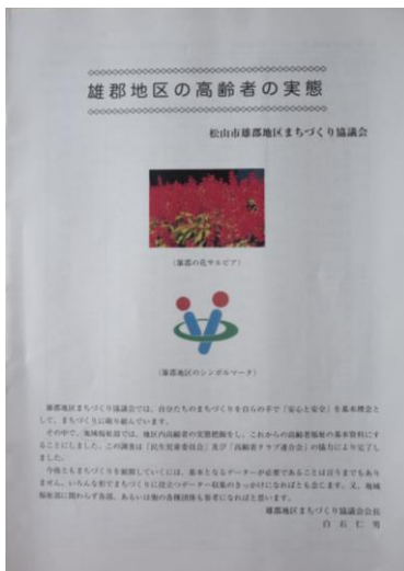
2012年「雄郡地区の高齢者の実態」作成