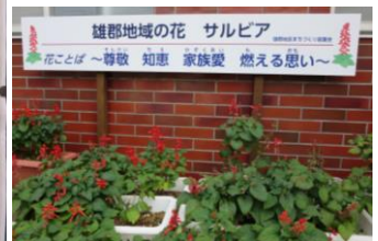
2020年7月 看板「雄郡の花サルビア」