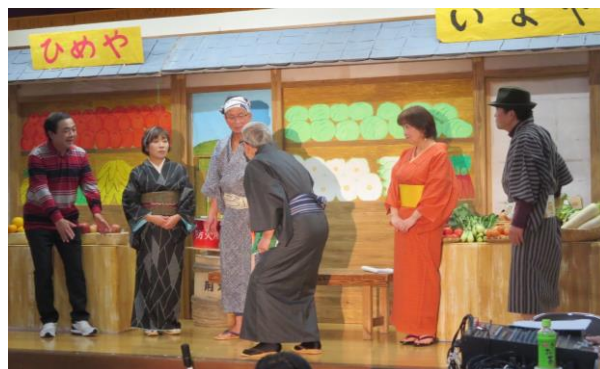
2020年2月 第7回音楽&芝居「ザ・ゆうぐん一座」