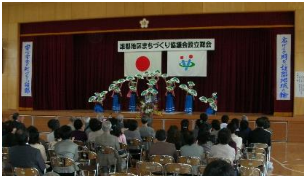
2009年4月18日 雄郡地区まちづくり協議会設立総会 於 雄新中学校