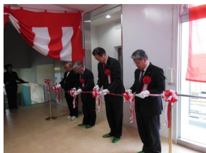
2014年1月 公民館改修エレベーター設置記念式典