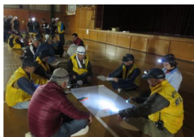
2017年11月 夜間停電時防災訓練