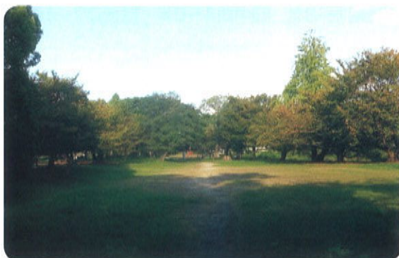
石手川緑地（北立花公園）