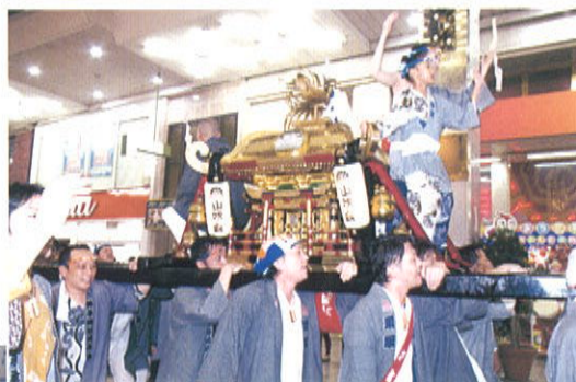
井手神社山吹神輿