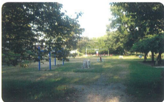
石手川緑地(永木公園)