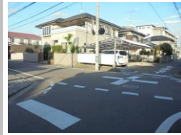
H29【NO. 4】 済