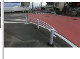
R1【NO. 1】 済