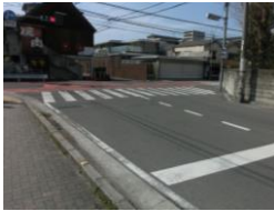
H29【NO. 1】 済

〔状況〕 交通量が多く変則的な交差点で、東側からの右折車がショートカットするため、危険です。