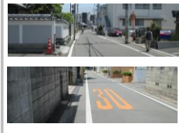
R3【NO. 102】 済