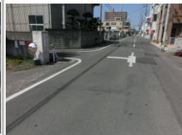
H29【NO. 3】 済

〔対策〕 外側線を引き直し、交差点内にドット線を引いて車の動線を示しました。歩道も補修しました。