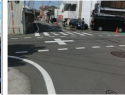
H29【NO. 5】 済