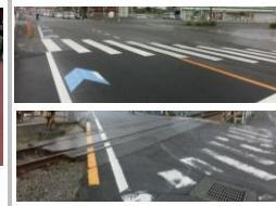
R1【NO. 2】 済