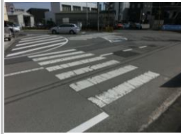
H29【NO. 2】 済

〔状況〕 北からの左折車が歩道側に進入して通ることが多く、また、歩道が一部陥没している箇所があります。