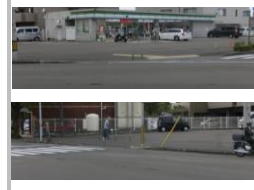
H30【NO. 1】 済