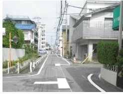
R3【NO. 101】 済