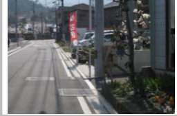
H29【NO. 3】 済

〔状況〕 見通しの悪い交差点で、危険です。 〔対策〕 標本を剪定し、見通しを良くしました。