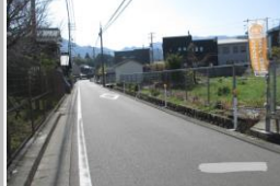
R3【NO. 101】 済

〔状況〕 道幅が狭く片側は用水路であり、中型のトラックも通っています。 〔対策〕 デリネーターを増設しました。