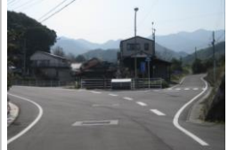
H29【NO. 5】 済

〔状況〕 道路の優劣が分かりにくく、どの道からもスピードを出したまま車が通る箇所です。 〔対策〕 ドット線を設置しました。