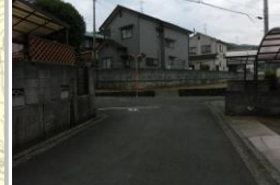
H29【NO. 4】 済

〔状況〕 三叉路の交差点で、見通しが悪い箇所です。 〔対策〕 カーブミラーを設置しました。