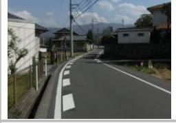
H29【NO. 1】 済

〔状況〕 道幅の狭い道路のため危険です。 〔対策〕 減速マーク・「30」規制の裏面標示を設置しました。