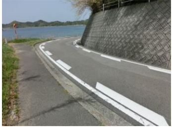
H29【NO. 1】 済