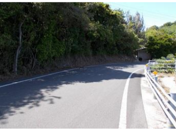
R3【NO. 101】 済

(状況) 道幅が狭く、狭い道の終わりから、中央線有りの上り坂のカーブにさしかかるので、対向車はスピードが出やすくなっています。