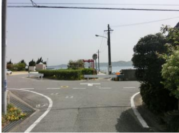
H29【NO. 2】 済