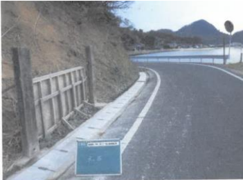
H29【NO. 3】 済

(状況) 一部、側溝に蓋がない箇所があり、歩行する空間が狭くなっており、注意が必要です。