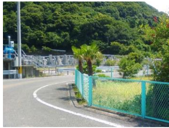
H29【NO. 4】 済

(状況) 直角に曲がるカーブで、公園の樹木が視界を遮っているため、見通しが悪く危険です。