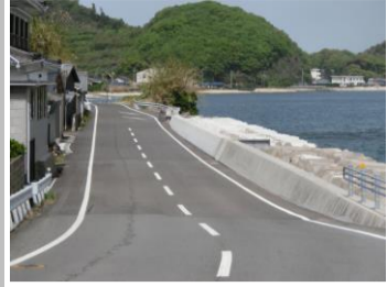
H29【NO. 5 H24-91】