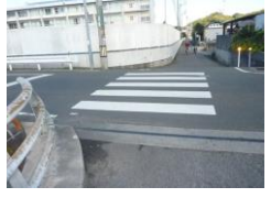
H29【NO. 3】 済

(状況) 外側線が引かれていない道路で、歩行時に注意が必要な箇所です。 (対策) 外側線を設置しました。