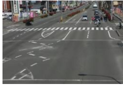
H29【NO. 5】 済

(状況) 交通量の多い大型の交差点で、外側線や横断歩道が薄くなっている。横断時に注意が必要です。 (対策) 外側線と横断歩道を引き直しました。