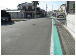
R3【NO. 101】 済

(状況) 道幅が狭く交通量が多いです。 (対策) 北側のグリーンベルトの延長と引き直しをしました。