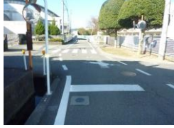
H29【NO. 2】 済

(状況) 外側線が引かれていない道路で、歩行時に注意が必要な箇所です。 (対策) 外側線を設置しました。