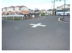
H29【NO. 6】 済

(状況) 交通量の多い交差点で、横断時に注意が必要です。 (対策) 外側線を引き直し、交差点マークを設置しました。