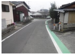
R3【NO. 102】 済

(状況) 道幅が狭く交通量が多いです。 (対策) グリーンベルトを設置しました。