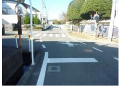
H29【NO. 1】 済

(状況) 見通しの悪い交差点で、横断時に注意が必要です。 (対策) 外側線・ドット線・横断歩道を設置しました。