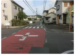
H30【NO. 1】 済

(状況) 道幅が狭く、交通量が多いです。 (対策) グリーンベルトを設置しました。