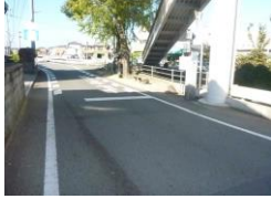
H29【NO. 4】 済

(状況) 歩道境が多化し穴が開いている部分がある。また、道路の停止線が薄くなっています。 (対策) 停止線を引き直しました。 歩道境の補修工事を完了しました。