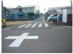
H29【NO. 8】 済

(状況) 交通量の多い交差点で、横断時に注意が必要です。 (対策) 交差点マーク・外側線を引き直しました。