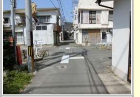
H29【NO. 5】 済

（状況） 道幅が狭い見通しの悪い交差点で、注意が必要です。 （対策） 交差点マークを設置しました。