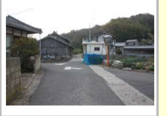
【NO. 3】 済

（状況） 道幅が狭い見通しの悪い交差点で、カーブミラーが汚れていて見にくくなっています。 （対策） 交差点マークを設置しました。カーブミラーを交換しました。