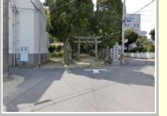
H29【NO. 4】 済

（状況） 奥に病院があり、バスも通行する箇所です。 （対策） 交差点マークを設置しました。