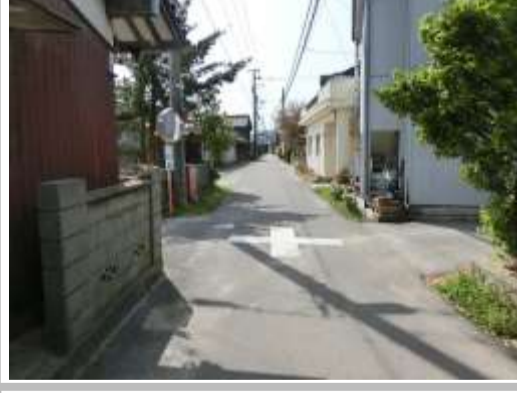
H29【NO. 7】 済

（状況） 道幅の狭い見通しの悪い交差点で、注意が必要です。 （対策） 交差点マークを設置しました。