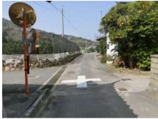
H29【NO. 6】 済

（状況） バイクの通行が多く、見通しも悪い箇所です。 （対策） 交差点マークを設置しました。