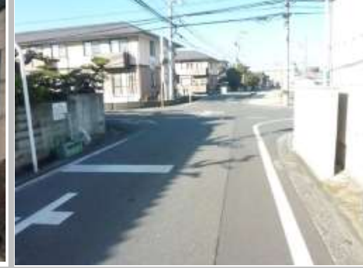
H29【NO. 6 H24-205】 済