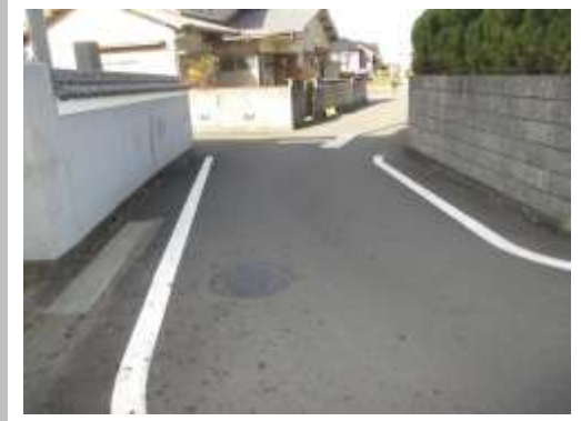
R3【NO. 1】 済