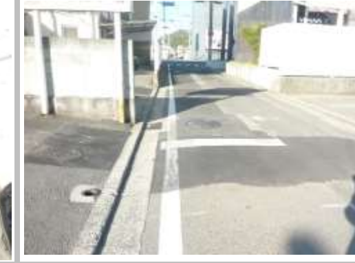
H29【NO. 7】 済