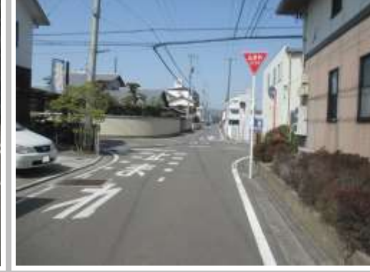
H29【NO. 5】 済