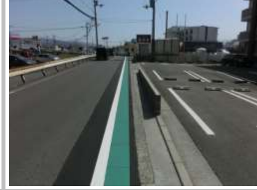
H29【NO. 4】 済