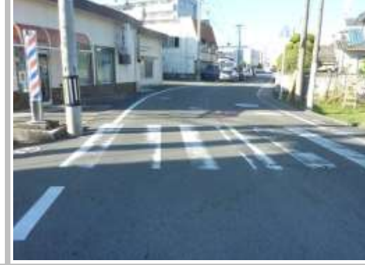
H29【NO. 3】 済