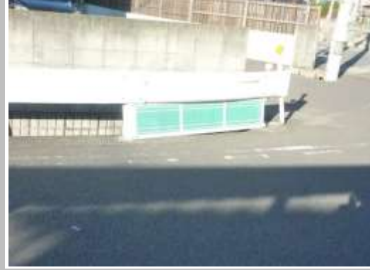
H29【NO. 1】 済