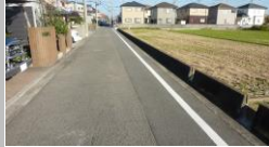
H29 [NO. 2] 済

(状況) 水路のある道路で、落下する恐れがあります。 (対策) 外側線を設置（水際側）しました。