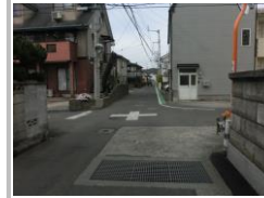
R1 [NO. 6] 済

(状況) 道幅が狭く歩道のない箇所が続きます。 (対策) グリーンベルト・外側線・交差点マークを設置しました。