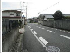
H29 [NO. 1] 済

(状況) 交通量の多い道路で、カーブで見通しが悪いので、横断歩道を横断する場合も注意が必要です。 (対策) 減速マークを設置しました。