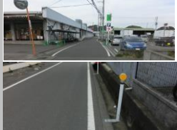
R1 [NO. 3] 済

(状況) 側溝部分に転落する危険性があります。 (対策) 側溝にデリネーターを設置し、外側線を引きました。