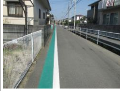
R2 [NO. 1] 済

(状況) 道幅が狭く通行量も多く危険です。 (対策) 外側線を設置及び引き直し、グリーンベルトを設置しました。