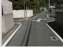
H29 [NO. 4] 済

(状況) 新空港通りから抜け道として利用する車が多く、道幅も狭いため、危険です。 (対策) 外側線・交差点マークを引き直しました。 横断歩道手前マークの引き直しについては一時停止とまれ文字があるので消さない。