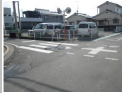
R3 [NO. 101] 済

(状況) 道幅が狭い上に、交通量も多いです。 (対策) 横断歩道を設置しました。