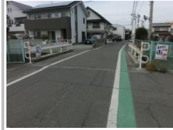
R1 [NO. 5] 済

(状況) 橋のガードレールについて、川のフェンスとの間に隙間があり転落の危険性があります。 (対策) ガードパイプを設置しました。