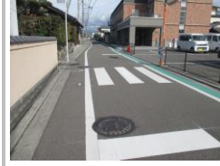
R3 [NO. 102] 済

(状況) 道幅が狭い上に、交通量も多いです。 (対策) 横断歩道を設置しました。