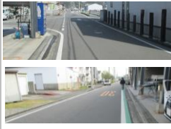
R1 [NO. 2] 済

(状況) 道幅が狭く歩道のない箇所があります。 (対策) グリーンベルトとドット線を設置し、外側線を引きました。