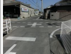
H29 [NO. 3] 済

(状況) 登下校時の交通量が多く道幅も狭いため、危険です。 (対策) 外側線・交差点マーク・ドット線を設置し、止まれを引きました。