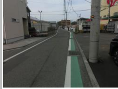
R1 [NO. 4] 済

(状況) 道幅が狭く歩道のない箇所が続きます。 (対策) グリーンベルトを設置し、外側線を引きました。