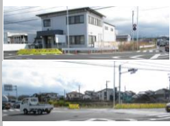
R3 [NO. 1] 済

(状況) 指定交差点が出来たが、交通量が多い上に、大型車両の通行量も多く危険です。 (対策) セーフティーウォールと巻き込み防止のバーを設置しました。