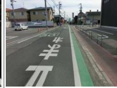
R1 [NO. 1] 済

(状況) 道幅が狭く歩道のない箇所があります。 (対策) グリーンベルトを設置し、外側線を引きました。