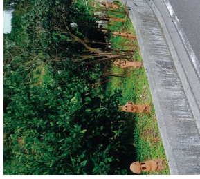
里山ふれあい広場のはいわ群