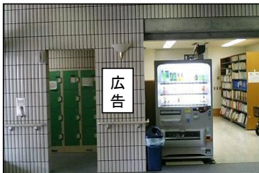
①1階自動販売機横掲出場所