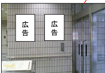
④1階玄関横掲出場所(2枠)