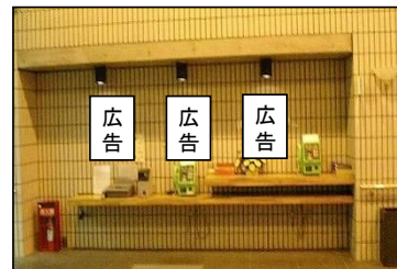
③1階ロビー公衆電話前掲出場所(3枠)