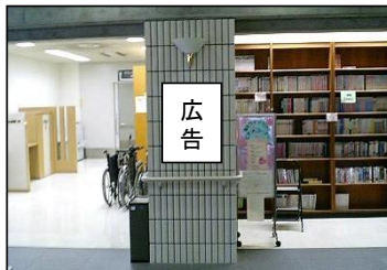
②1階書庫横掲出場所