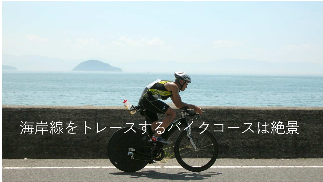
海岸線をトレースするバイクコースは絶景