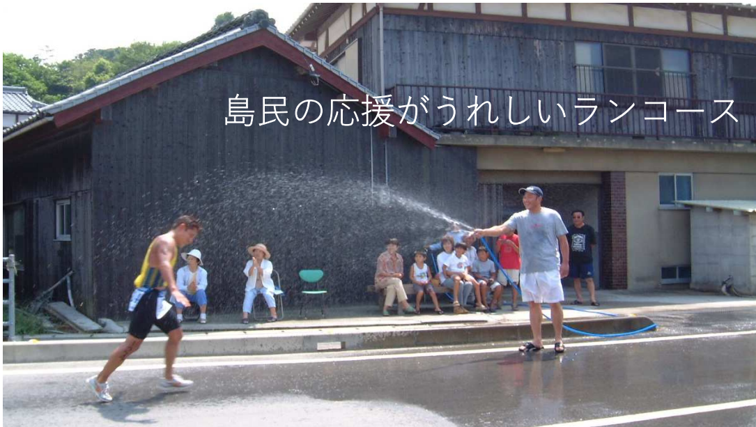
島民の応援がうれしいランコース