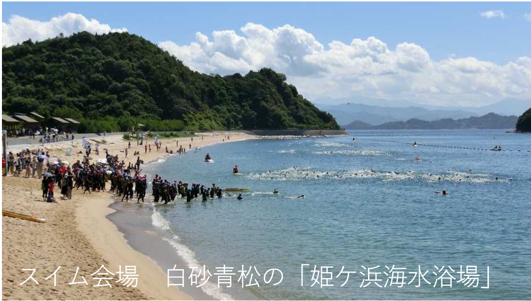
スイム会場 白砂青松の「姫ヶ浜海水浴場」