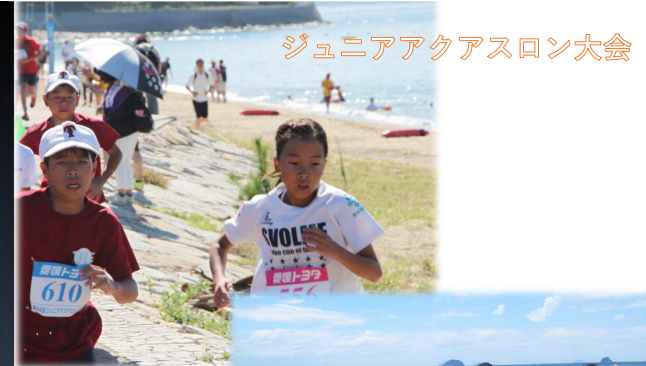
トライアスロンプライベート