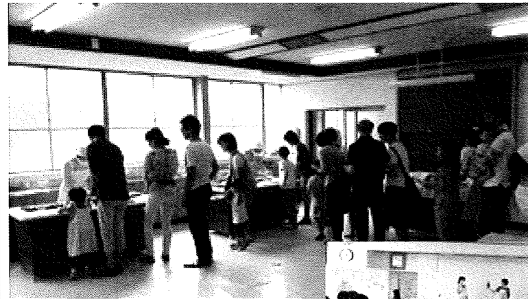
バランスのよい昼食を 家族で選ぶ参加者