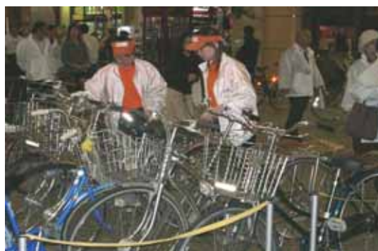
【学生によるボランティア活動の様子】