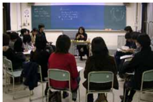
【NPOによるボランティア講座の様子】