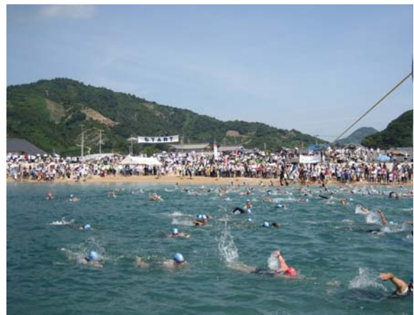
第21回トライアスロン中島大会