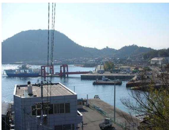
泊漁港フェリー乗降状況