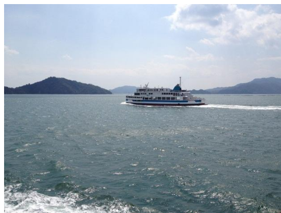
クルーズフェリーで巡る瀬戸内海