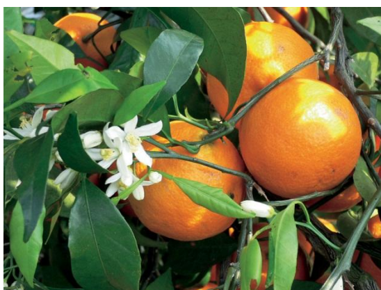
まつやま農林水産物ブランド ～カラマンダリン～