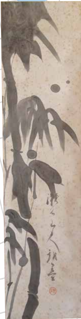
漱石の墨竹画(個人蔵)