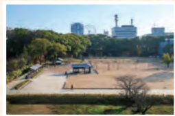
さまざまなイベントの舞台に 城山公園堀之内地区

屏風折石垣 間隔を置いて屏風のように折り曲げた組み方のこと。折れ目をつくることで、石垣の強度を高めるとともに、攻め手を側面から攻撃することができる「横矢掛かり」が仕込まれている。