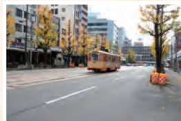
市駅前から堀之内を結ぶ 花園町通り