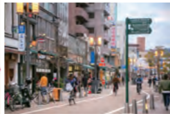
洒落た雰囲気のあるロープウェイ街