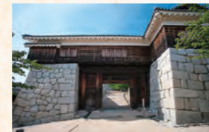
三之丸、二之丸から本丸へ 向かう松山城最大の城門!

江戸時代以前に建てられた天守は、今、国内に12城しか残っていません。松山の中心に位置する標高132メートルの勝山に本丸を構える松山城は、その貴重な「現存十二天守」のうちの一つです。1602(慶長7)年に築城を開始したのは、関ヶ原の戦いで功績のあった加藤嘉明ですが、この時の天守は後に改築され、さらに落雷によって焼失。現在の天守は1854(安政元年)に再建落成したものです。「我が国最後の完全な城郭建築」とも呼ばれており、威厳に満ちたその姿は松山市民の誇りとなっています。城内を観覧できる天守をはじめ野原櫓、乾櫓、天守へと至る一ノ門、戸無門、