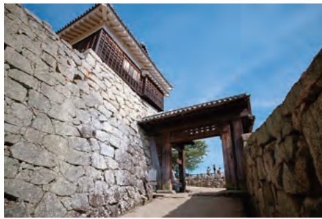
昔から門扉がない重要文化財の戸無門

お城好きが高じて松山城のガイドをしている私にとって、松山城は最も親しみのあるお城であり、知れば知るほど「郷土の宝」であることを感じます。だからこそ、「来てよかった」「松山城ってすごい、面白い」と思っています。21もの重要文化財があるということは、それだけ当時の建物が残されているということです。江戸時代のお城の縄張りを知るならまずは松山城を見ていただきたい。特に地元の子供たちには、この「宝」をしっかり伝えていきたいと思っています。