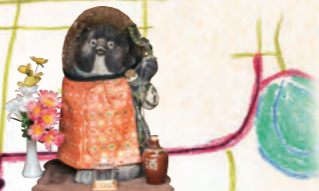
松山には理伝説がいっぱいあるよ!