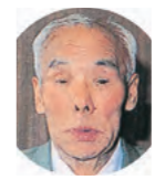
千葉 茂氏 Chiba Shigeru 大正8年5月10日～平成14年12月9日 元プロ野球選手・野球評論家。名二塁手として巨人軍の第1・第2黄金期を築いた。近鉄監督も務め、昭和55年に野球殿堂入り。オールスターゲームの松山誘致に尽力された。(平成14年7月12日授与)