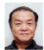
早坂 暁氏 (本名 富田 祥資) Hayasaka Akira 昭和4年8月11日～平成29年12月16日 作家・脚本家。代表作「花へんろ」をはじめ、生まれ育った北条地区をたびたび作品に取り上げ、本市の全国的な周知に尽力。また市制100周年を記念して創設した「坊っちゃん文学賞」では、創設から30年にわたり審査員を務め、「ことばと文学のまち松山」の発展に貢献された。(平成30年2月16日授与)