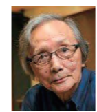
天野 祐吉氏 Amano Yukichi 昭和8年4月27日～平成25年10月20日 コラムニスト。平成14年11月子規記念博物館館長に就任。「道後寄席」の実施など親しみやすい博物館づくりに尽力。また「ことばのちから事業」など本市の魅力向上事業に多大な貢献をされた。(平成26年4月21日授与)