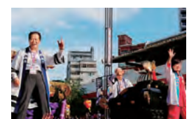
台北市で披露した神輿鉢合わせの様子