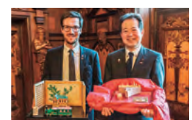
フライブルク市役所での歓迎式典