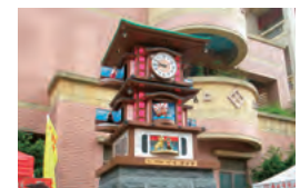
松山国民小学校前にある「松山・道後温泉幸福からくり時計」