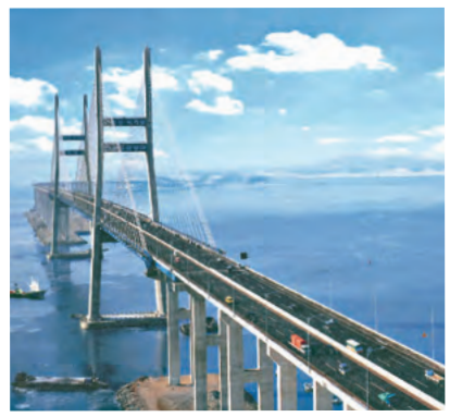
平澤港へとつながる「西海大橋」