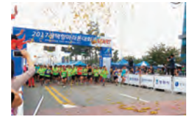
毎年秋に開催の平澤港マラソン大会