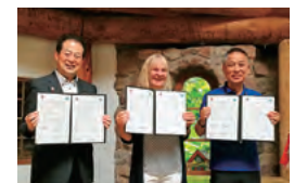
エコフレンドシップ協定を再締結