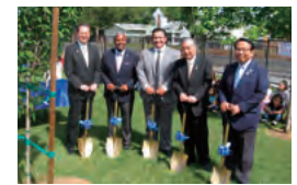
姉妹校での記念植樹