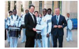
ダレル・スタインバーグ市長と姉妹校の生徒による歓迎