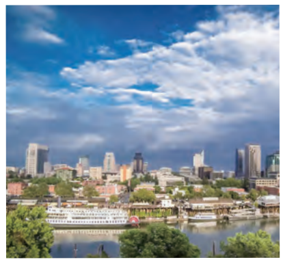
州都として発展するサクラメント市

台北市は台湾の政治・経済の中心都市で、世界屈指の高さを誇る「台北101」や「国立故宮博物院」、北投温泉など新旧さまざまな観光資源があります。 漢字で同じ「松山」という地名や、共に最古といわれる温泉があることを縁として交流を開始し、観光・文化・スポーツなど幅広い分野で交流を進めてきました。令和元年には友好交流協定締結5周年などを記念し、台北市で道後神輿の鉢合わせを披露しました。