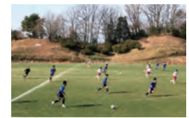
平澤FC U-18とのサッカー交流