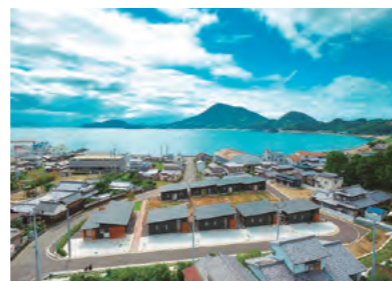
興居島体験滞在型交流施設「ハイムインゼルごこしま」

また、高校や大学と連携し、若者が松山の魅力や暮らしやすさなどを知り、地域活動に参加し、活性化に貢献する機会を創ります。そうすることで、誇りや愛着を育み、地域を担う人材を育成し、将来の定住やUターンを促します。