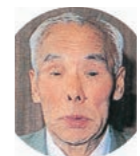
千葉 茂氏 Chiba Shigeru 大正8年5月10日～平成14年12月9日 元プロ野球選手・野球評論家。名二塁手として巨人軍の第1・第2黄金期を築いた。近鉄監督も務め、昭和55年に野球殿堂入り。オールスターゲームの松山誘致に尽力された。(平成14年7月12日授与)