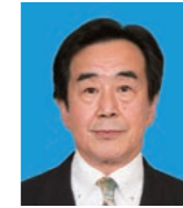
副市長 梅岡 伸一郎 Umeoka Shinichiro