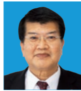
副議長 菅 泰晴 Kan Yasuharu