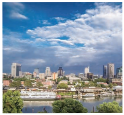
州都として発展するサクラメント市

台北市は台湾の政治・経済の中心都市で、世界屈指の高さを誇る「台北101」や「国立故宮博物院」、北投温泉など新旧さまざまな観光資源があります。 漢字で同じ「松山」という地名や、共に最古といわれる温泉があることを縁として交流を開始し、観光・文化・スポーツなど幅広い分野で交流を進めてきました。令和元年には友好交流協定締結5周年などを記念し、台北市で道後神輿の鉢合わせを披露しました。