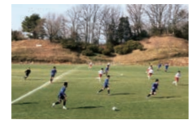
平澤FC U-18とのサッカー交流