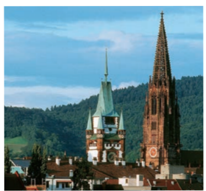
フライブルク市のシンボルマルティン門とミュンスター

サクラメント市は、カリフォルニア州の州都としてワールドラッシュの最中に誕生しました。市内には多くの文化遺産が残る美しい都市で、市花は松山市と同じ「つばき」であることから「つばきと文化の都」とも呼ばれます。 平成28年に姉妹都市提携35周年を迎え、平成29年には記念訪問団がサクラメント市を訪問しました。松山市のPRのほか、姉妹校提携調印式への出席や記念植樹を行うなど交流を深めています。