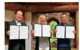
エコフレンドシップ協定を再締結