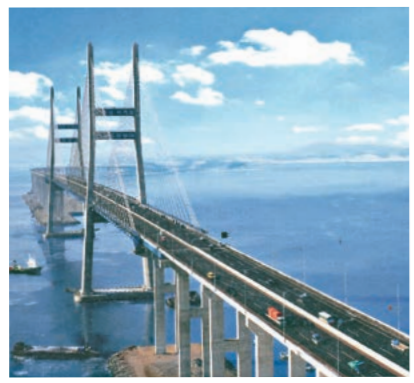
平澤港へとつながる「西海大橋」

国や地域を越えて、人・もの・情報が活発に行き来し、世界的な相互依存関係が強まる中、異なる文化や価値観を認め、尊重し合いながら、世界の人々と交流を深めることが大切です。 松山市ではサクラメント市（アメリカ）、フライブルク市（ドイツ）と姉妹都市提携を、平澤市（韓国）と友好都市提携を、台北市（台湾）と友好交流協定を結び、幅広い分野で親善交流を行い国際化を進めています。