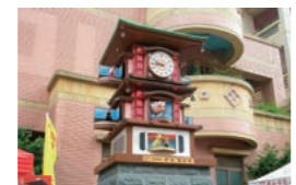
松山国民小学校前にある「松山・道後温泉幸福からくり時計」