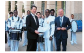
ダレル・スタインバーグ市長と姉妹校の生徒による歓迎