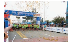
毎年秋に開催の平澤港マラソン大会