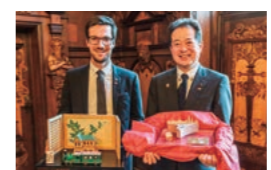
フライブルク市役所での歓迎式典