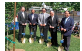
姉妹校での記念植樹