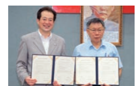
台北市との友好交流協定再調印