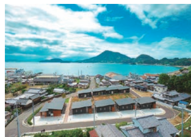
興居島体験滞在型交流施設「ハイムインゼルごこしま」

また、高校や大学と連携し、若者が松山の魅力や暮らしやすさなどを知り、地域活動に参加し、活性化に貢献する機会を創ります。そうすることで、誇りや愛着を育み、地域を担う人材を育成し、将来の定住やUターンを促します。