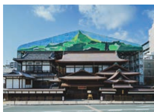
道後REBORNプロジェクト

農業では、担い手の高齢化が進んでいるため、就農前から営農定着までの一貫した支援、収益性の高い産品の販路開拓・拡大などで所得を高めるほか、スマート農業を研究・導入し省力化や効率化するなど、若い世代をはじめ幅広い担い手を確保するよう進め、農業を成長する産業にします。