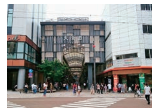
一番町大街道入口

「坂の上の雲」のまちづくりをはじめ、地域住民やNPOなどによる補助制度を活用して、まちづくり活動を盛んに行っています。今後は、こうした民間の主体的な取り組みとの連携も強化し、協働を進め、「選ばれるまち」、「住み続けたいまち」にしていきます。