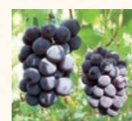
伊予・五明こうげんぶどう