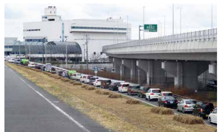
南クリーンセンター混雑の様子