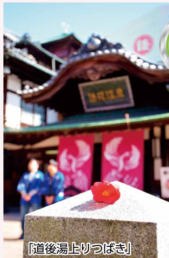
「道後湯上りつばき」