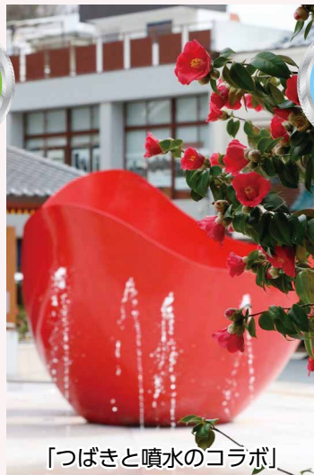
「つばきと噴水のコラボ」