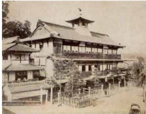
明治時代の道後温泉本館

『坂の上の雲』の時代背景である明治や、舞台となった松山の歴史・文化と一緒に学びませんか。 ① 6～9月の①「近代国家とは何か」＝毎月第2土曜日、②「松山」＝毎月第4土曜日。いずれも14時～15時30分 ③ 坂の上の雲ミュージアム（一番町三丁目）3階会議室 ④ 定各40人（抽選） ⑤ 各1,200円 ⑥ 5月26日(日)（必着）。はがきまたは、ファクス・eメール。住所、氏名、電話番号、講座名を〒790-0001一番町三丁目20坂の上の雲ミュージアム講座係 ⑦saka-museum@city.matsuyama.ehime.jpへ ⑧ 坂の上の雲ミュージアム事務所 ☎915-2601・FAX 915-3600