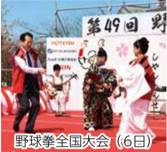
野球拳全国大会 (6日)

松山の春の風物詩「松山春まつり (お城まつり)」が4月4・6・7日に開催され、多くの観客でにぎわいました。