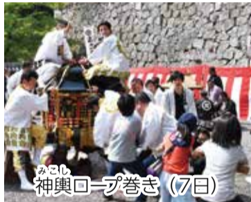
みこし神輿ロープ巻き (7日)