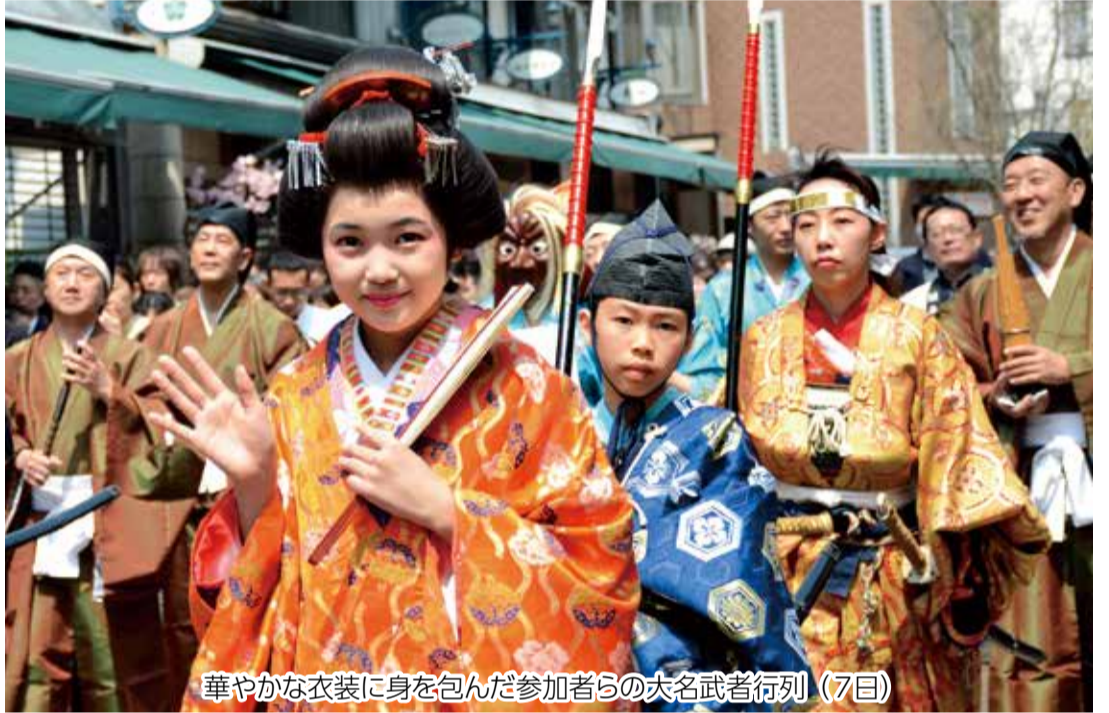
華やかな衣装に身を包んだ参加者の大名武者行列 (7日)