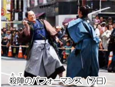
たて殺陣のパフォーマンス (7日)