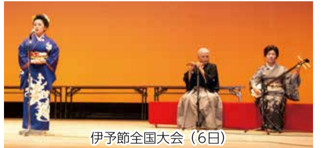
伊予節全国大会 (6日)