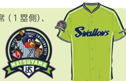
松山オリジナルワッペン 松山燕パワーユニホーム

内野S指定席および内野A指定席(1塁側)、内野2階指定席(ネット裏)の前売券をご購入した人に試合開催日当日、坊っちゃんスタジアム特設引換所で松山限定燕(エン)パワーユニホームをプレゼント