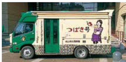
新しくなった移動図書館車「つばき号」

宝くじの社会貢献広報事業である(一財)自治総合センターのコミュニティ助成事業を活用し、移動図書館車「つばき号」4台の内1台をリニューアルしました。 移動図書館は、図書館から離れた地域で図書の出し出し・返却・予約などのサービスを提供するために、市内166カ所を定期的に巡回していますので、ぜひご利用ください。 ※詳しい日程は、市ホームページを確認 ☎中央図書館事務所☎9438008・FAX9339968