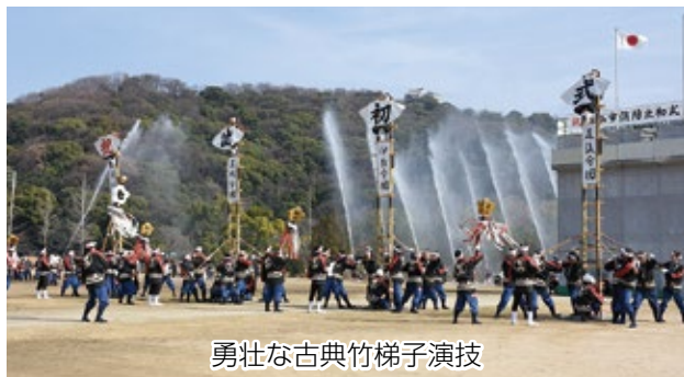
勇壮な古典竹梯子演技

式には消防職員、消防団員、女性防火クラブ連合会、大学生防災リーダークラブから約1900人が参加したほか、はしご付消防自動車など消防車両25台が集結。分列行進をはじめ、火災現場さながらの迫力ある消防職員訓練や高さ6メートルの先端で消防団員が行う「古典竹梯子演技」など、洗練された消防技術が披露され、集まった観客たちからは大きな拍手が起きていました。 ☎地域防災課 926 9222 FAX 926 9189