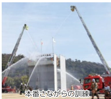
本番さながらの訓練