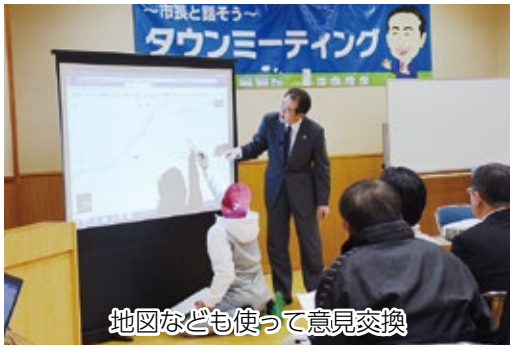
地図なども使って意見交換