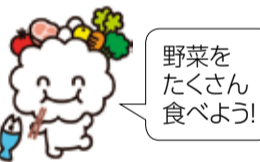
市食育推進キャラクター「モグッピー」

シピを考案し、まつやま食育フェスタで人気投票やレシピカードの配布などを行い、周知啓発に取り組みました。 今年度は松山大学生協、生協食堂部局の学生と「野菜レシピコンテスト」を開催中で、コンテストで上位入賞したレシピは、実際に松山大学生協食堂で商品化し、提供される予定です。 みなさんも、ぜひ野菜料理をもう1品取り入れて、健康な体を目指しましょう!