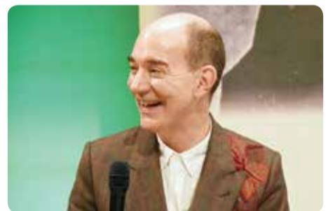
ロバート キャンベルさん