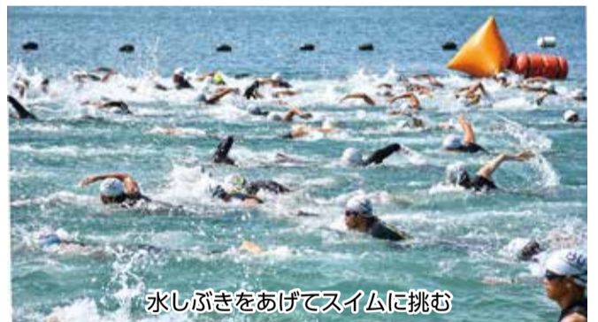
水しぶきをあげてスイムに挑む