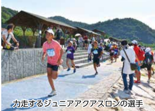
力走するジュニアアクアスロンの選手