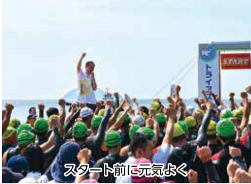
スタート前に元気よく