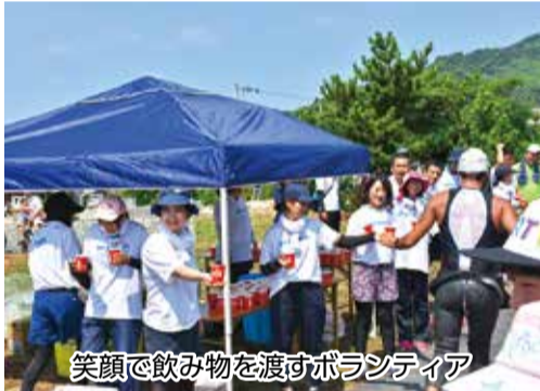
笑顔で飲み物を渡すボランティア