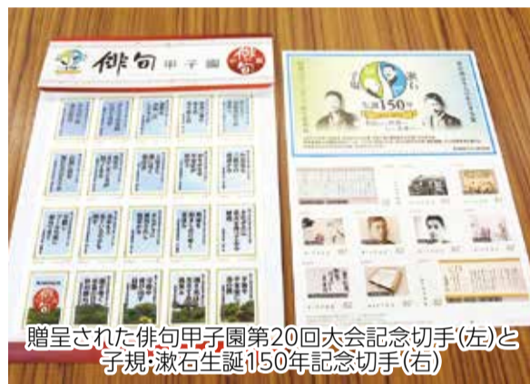
贈呈された俳句甲子園第20回大会記念切手(左)と子規・漱石生誕150年記念切手(右)

※7月中旬に説明会を実施。詳細は別途通知 ☎ トライアスロン中島大会実行委員会(中島支所内) ☎997-1840・FAX 997-1585