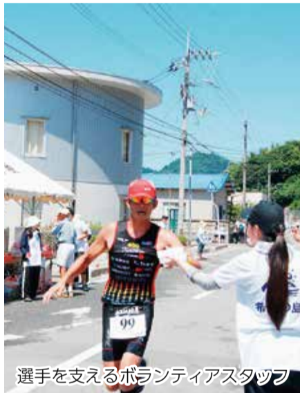
選手を支えるボランティアスタッフ

【申し込み】 6月23日(金)(消印有効、eメールは17時)までに、はがきまたは電話、ファクス、eメールで、住所、氏名、年齢、性別、電話番号、所属団体名(学校名)を〒790-0808 若草町8-2 市ボランティアセンター ☎921-2141・FAX 921-8360・E vc@matsuyama-wel.jpへ