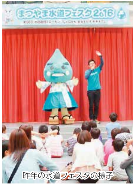
昨年の水道フェスタの様子

水道週間(6月1~7日)の全国統一スローガン「あたりまえそんなみずこそ たからもの」のもと、「まつやま水道フェスタ2017」を開催します。家族で楽しめるイベントをたくさん用意しています。ぜひお越しください。