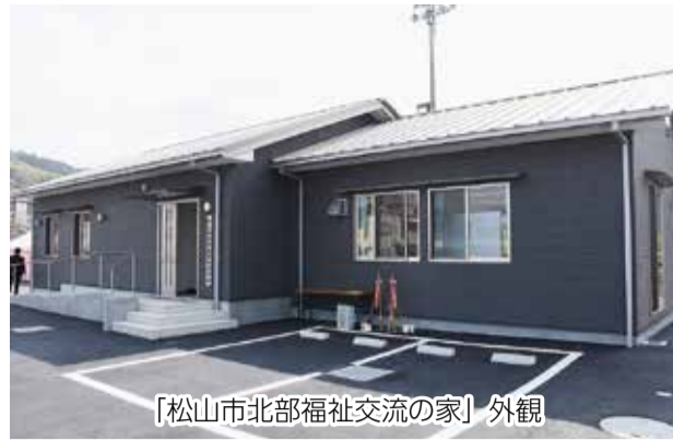
「松山市北部福祉交流の家」外観

【日時】 6月11日(日)10~14時 【会場】 総合コミュニティセンター(湊町七丁目)こども館 【内容】 ショーやクイズラリー、給水体験など 【問い合わせ】 水道サービス課 ☎998-9885・☎948-0727