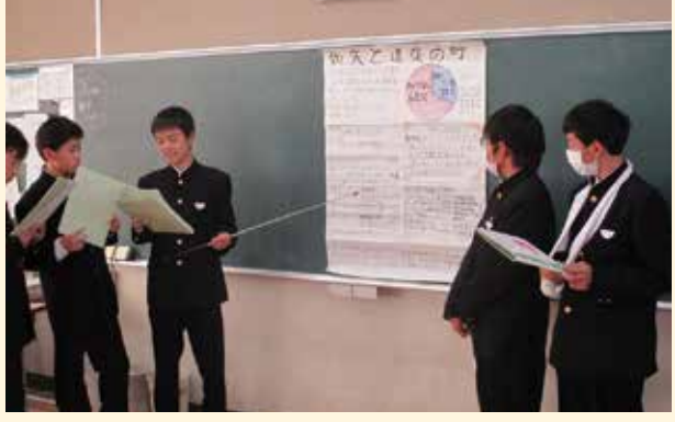
総合的な学習の時間「道後を再発見しよう」で如矢の功績を紹介