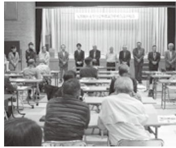
準備会設立総会の様子(久谷地区)

地域住民や団体が連携して組織するネットワーク型の住民自治組織「まちづくり協議会」。4月9日に日浦地区、4月27日に浅海地区で協議会が設立され、4月14日には久谷地区(荏原、坂本地区)で準備会が設立されました。これで市内に19地区で協議会、2地区で