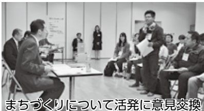
まちづくりについて活発に意見交換

若い世代のまちづくりへの参加と 地域活動の活性化をテーマに開催 桑原地区のまちづくりについて「若い世代のまちづくりへの参加と地域活動の活性化」をテーマに4月20日、桑原公民館でタウンミーティングが行われました。 参加者からは、「市政広報番組などで、地域の若い人たちの活動を取り上げてほしい」「もっと住民に地域活動に参加してもらえよう啓発してほしい」などさまざまな意見が挙がりました。