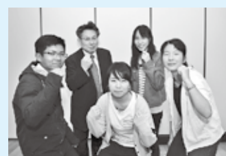
桑原地区まちづくり協議会 学生部の皆さん

地域の人や市長の考えを聞くことができ有意義な時間でした。私たちが学生が地域と若い世代をつなぐ懸け橋になれるよう、地域の魅力を発信していきたいです。