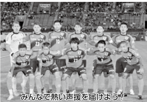
みんなで熱い声援を届けよう!