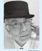
イッセー尾形 (俳優)