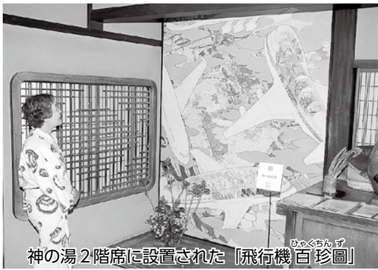
神の湯2階席に設置された「飛行機百珍圖」

当日に開催されたオープニングイベントでは、式典とトークイベントが子規記念博物館(道後公園)で行われ、約300人が