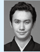
田中傳次郎 (歌舞伎囃子方)