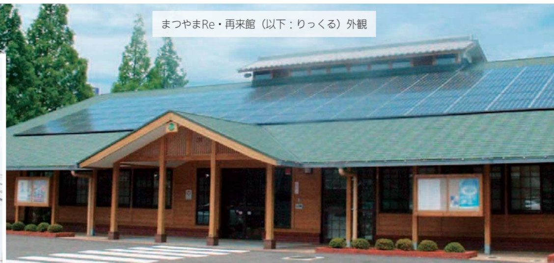
← 空港通一丁目。目印は伊予鉄道郡中線線路沿いのりっちゃん・くるくんの看板です。

りっくろは、「松山市にリサイクルセンターを!」という市民の声を受けて、平成14年7月7日に誕生しました。