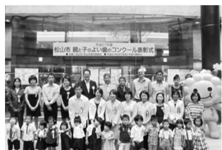
昨年度の表彰式の様子

1歳6カ月から3歳までにかけて、幼児の虫歯保有率が急増することから、虫歯がなく規則正しい生活を送っている3歳児とその親を表彰します。歯の健康に気を付けている皆さん、ぜひご応募ください。