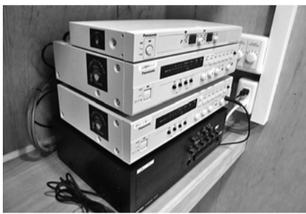
整備されたアンプ

(一財)自治総合センターの宝くじ受託事業収入を財源としたコミュニティ助成事業の助成金で、次のとおり地域コミュニティのための備品が整備されました▶一の宮団地町内会＝放送設備(アンプ、スピーカー) 問 市民参画まちづくり課 ☎948-6963・FAX934-3157