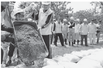
水防工法を学ぶ参加者