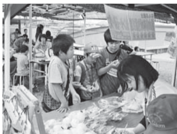
子どもでにぎわう屋台

当日は施設周辺を歩く健康ウォーキングや歯科医師の講演など、健康増進イベントに加え、つきみチャレンジや射的