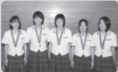
松山東高A (6月19日受賞)

第21回JAWA全日本マス ターズアームレスリング選 手権大会40代の部 男子の部 ライトハンド80キ