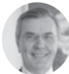
ラッシュ・ヴァリエ 駐日スウェーデン大使

内容【第1部】ラッシュ・ヴァリエ駐日スウェーデン大使による基調講演「世界から見た俳句の魅力」(仮)