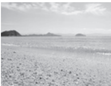
会場の姫ヶ浜ビーチ

日時 8月2日(土)11〜16時 会場 姫ヶ浜ビーチ(中島) 内容【キャンプ関連】キャンプグッズの展示・販売、地元