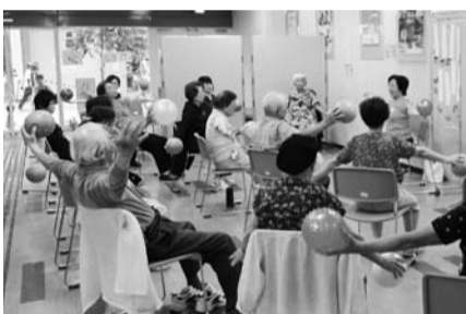
「ふれあい・いきいきサロン事業」で介護予防の運動を行う高齢者