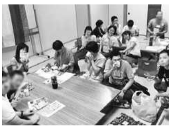
性的マイノリティーの正しい知識と理解を広げる活動をするレインボープライド愛媛

「性的マイノリティー」というと松山では関係ないと思うかもしれませんが、実は人口の約6%が同性愛者や性同一性障がい者として生活していますが、差別や偏見・無理解を恐れ、家族にさえも本当のことを言えずにいます。私たちが活動している「扱