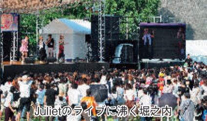
Julietのライブに沸く堀之内