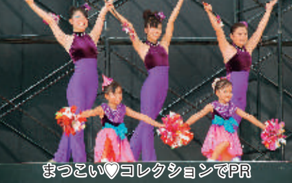
まつこい♡コレクションでPR