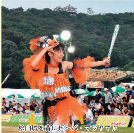
松山城を背にビ〜パ・マツヤマ

市勢 平成24年8月1日現在推計(前月比) ●面積:429.05km 2 ●人口:516,847人(+44) ●男:241,163人 ●女:275,684人 ●世帯数:227,586世帯(+75) ●1世帯の平均:2.27人 ●人口密度:1,205人/km 2