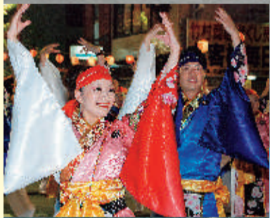
華麗なステップで観客を魅了