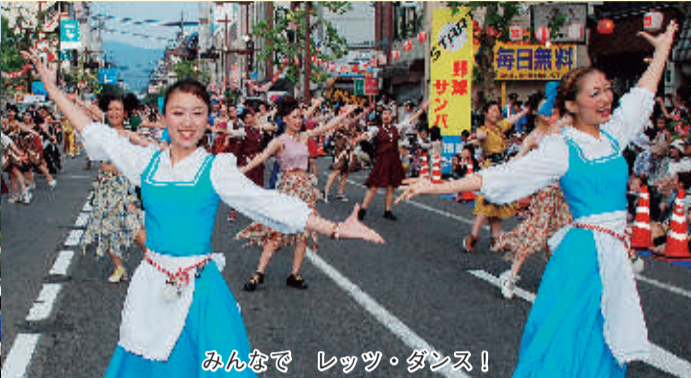
みんなで レッツ・ダンス!