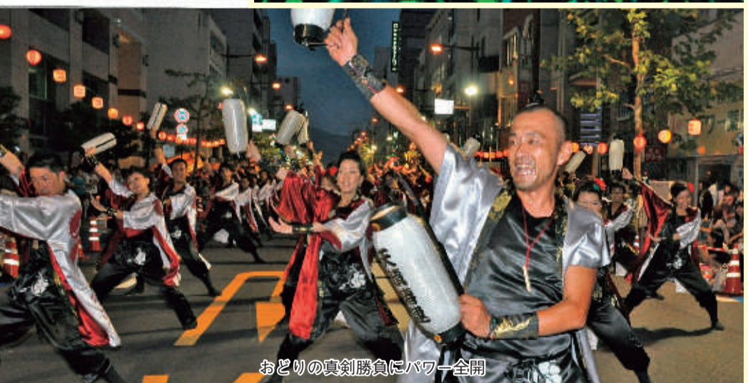
おどりの真剣勝負にパワー全開