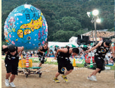
千舟町通りでヨイノヨイ