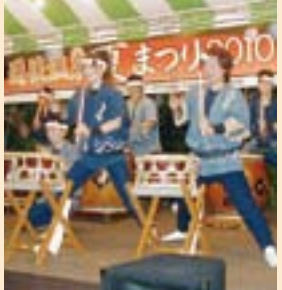
「道後温泉夏まつり」が8月1日〜31日まで、道後温泉本館周辺で開催されます。

「道後温泉夏まつり」が8月1日〜31日まで、道後温泉本館周辺で開催されます。 オープニングイベント「道後村まつり」 1日(月) 9時30分〜湯釜薬師祭、19時〜オープニング、マドンナ任命式 2日(火) 19時〜お楽しみ野球拳大会 1日(月)・2日(火) 13時〜みんなでチャレンジ! スポーツテスト・道後ハイカラ通りクイズゲーム、14時〜人力車体験、18時〜ふれあいコンサート・夜市、20時〜郷土芸能 そのほかのイベント(予定) 日程・内容 1日(月)〜31日(水) 水光プロムナード・道後温泉お湯かけ祈願・昔懐かしいキャンディー販売・風の音「風鈴まつり」和太鼓・郷土芸能 1日(月)〜7日(日) 七夕まつり 11日(木)〜13日(土) 松山まつり in 道後 13日(土)〜15日(月) 子ども花火大会「線香花火」 28日(日) 道後湯あがり朝市 28日(日) まで 子規記念博物館特別展「子規と鷗外」知られざる交流 31日(水) 19時30分〜「フライング」イベント ※道後お伽座、芸子楽納涼夏の踊り、えひめ地産地消 in 道後味フェスタなども開催