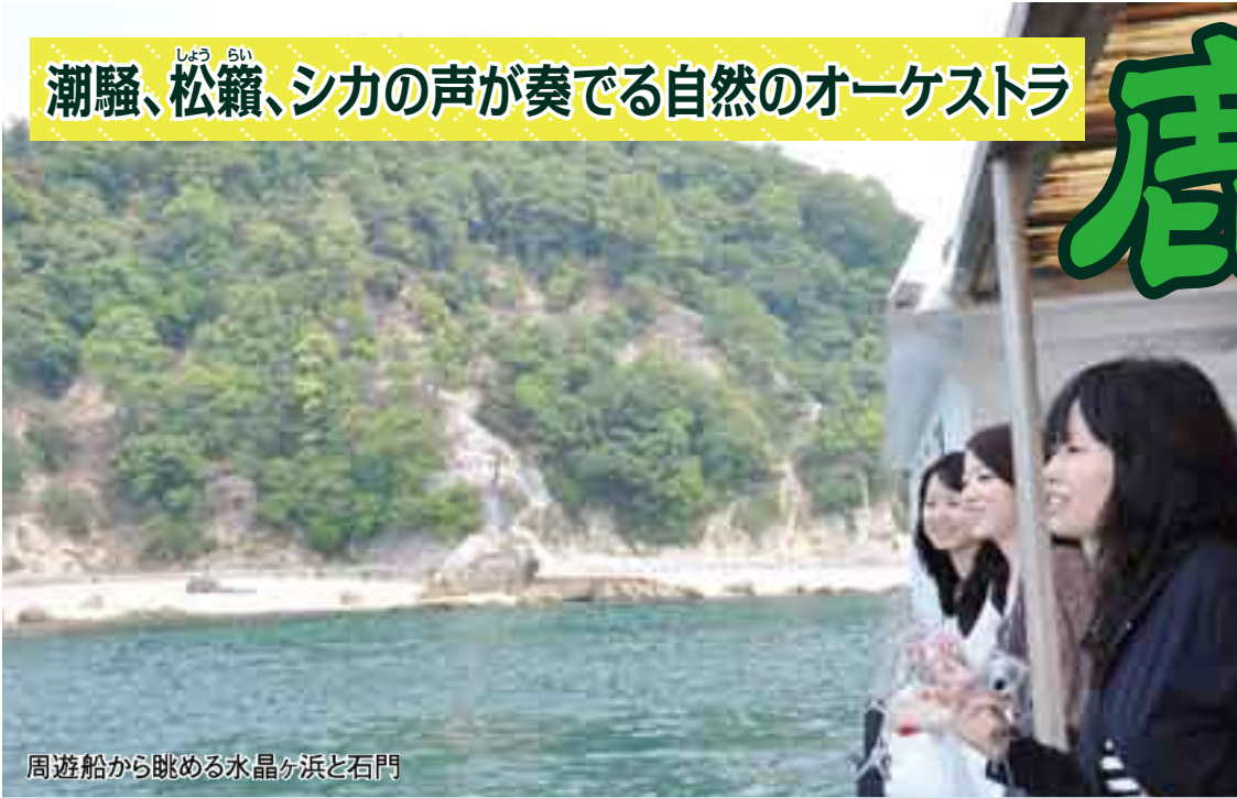
周遊船から眺める水晶ヶ浜と石門

市中心部を北進し粟井坂を越えると、目前に飛び込む緑の小島「鹿島」。自然あふれるこの島の再生と活性化を図るため、渡船や駐車場、周遊船の料金を値下げする社会実験を実施します。ぜひ、「誇れる地域の宝」鹿島へお越しください。