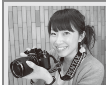
テレビ愛媛で放送

「だから、ことば大募集」の入選作品がリムジンバス・郊外電車にラッピングされ、6月24日、出発式が行われました。心温まることばで松山を訪れた人や市民に笑顔をお届け、ことばを大切にすまちな松山を広くPRしていきます。