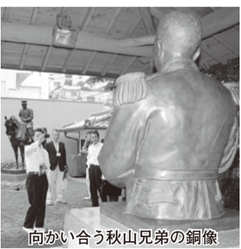
向かい合う秋山兄弟の銅像

【コース】 松山城「志」「絆」 ↓秋山兄弟生誕地「知恵」「戦略」「夢」↓石手寺「癒やし」「お