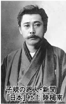
子規の恩人・新聞社主 陸羯南