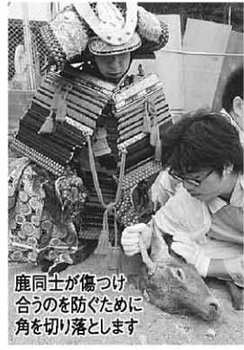
鹿同士が傷つけ合うのを防ぐために角を切り落とします

中世の伊予国を舞台に活躍した河野氏の歴史をたどるとともに、風早地方の自然と文化に触れる「河野氏まつり」を開催します。