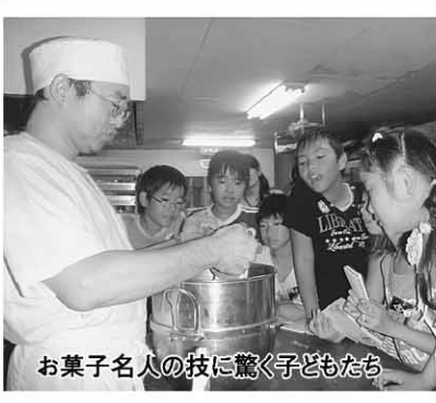
お菓子名人の技に驚く子どもたち

味酒小学校の5年生は毎年、和菓子作り、筆作りなど地域で活躍する名人を訪ね、その仕事ぶりから技や考え方を教わっています。