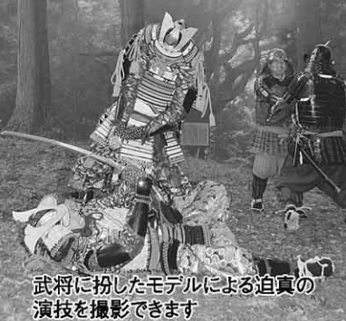
武将に扮したモデルによる迫真の演技を撮影できます

小説「坂の上の雲」の時代背景である明治期や松山の魅力を、各分野で活躍する講師から学ぶ連続講座(後期)の受講生を募集します。